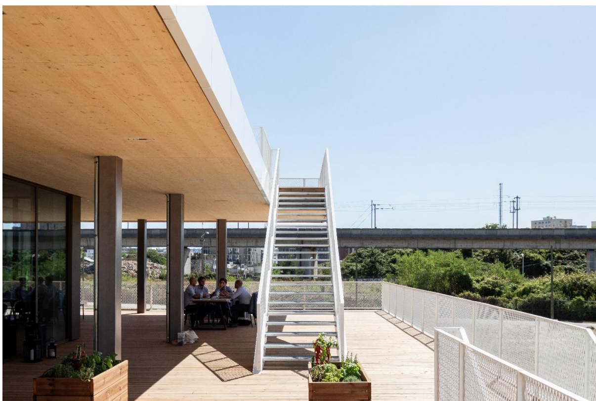
ARBORETUM, Nanterre

Les architectes de l'opération sont François Leclercq (Leclercq Associés – mandataire du projet), Nicolas Laisné (Nicolas Laisné Architectes), Dimitri Roussel (DREAM), Hubert & Roy et Antoine Monnet, le paysagiste Franck Poirier (BASE), le designer Olivier Saguez (Saguez & Partners). Les travaux débutent à l'été 2020 pour une livraison prévue fin 2022. La maîtrise d'ouvrage déléguée du projet sera assurée par WO 2 . Les commercialisateurs retenus sont BNP Paribas Transaction, Cushman & Wakefield et JLL.